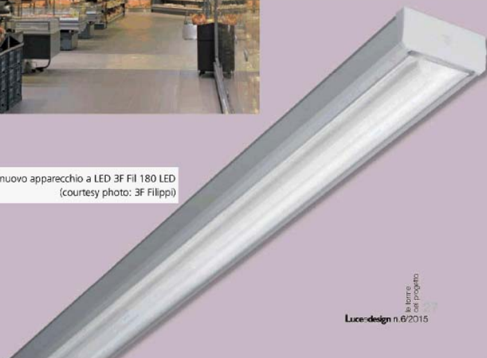
Il nuovo apparecchio a LED 3F Fil 180 LED

le forme del progetto Luce&design n.6/2015