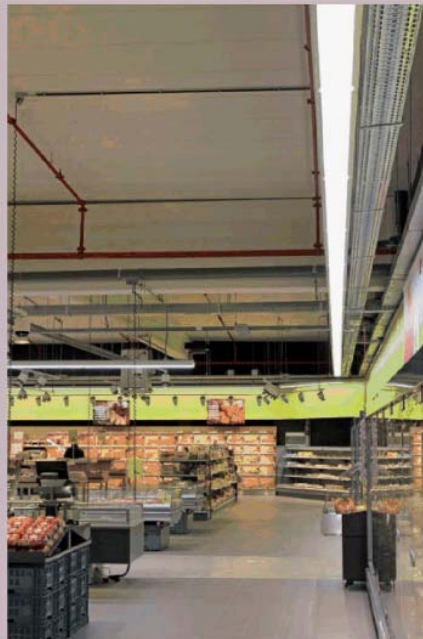
Due differenti immagini del punto vendita Carrefour