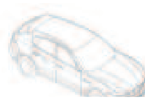
Maserati Levante - Brevetti

Tag: 3f filippi , fiat , Fiat Mirafiori , Fiat Mirafiori 3F Filippi , illuminotecnica 3f filippi , Maserati Levante , Mirafiori