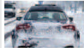
Maserati Levante - Foto spia 16-01-2015