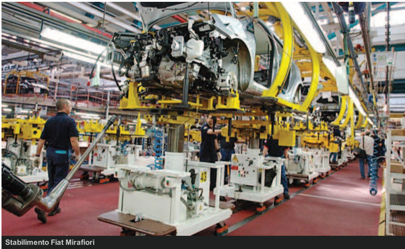
Stabilimento Fiat Mirafiori

Le linee produttive dello stabilimento Fiat Mirafiori di Torino , dove da gennaio 2016 verrà costruita la Maserati Levante , il primo SUV del marchio del Tridente, saranno illuminate dalle luci della 3F Filippi , la rinomata azienda bolognese specializzata in illuminotecnica. Recentemente la 3F Filippi ha installato 700 dei propri apparecchi per fornire l'adeguata illuminazione al Museo Storico di Alfa Romeo che ha riaperto le porte al pubblico un mese fa.