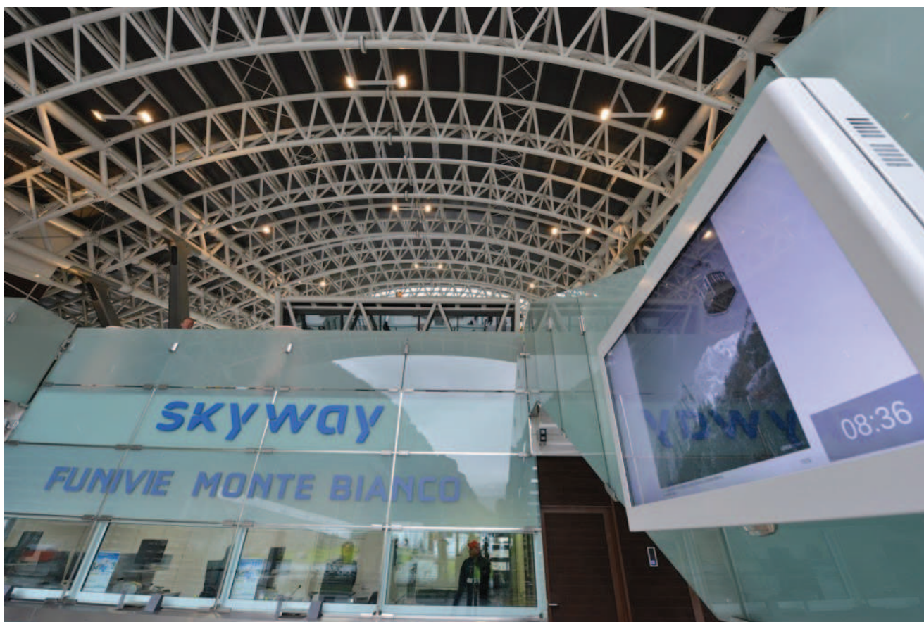
Skyway Monte Bianco

Per i locali tecnici, i parcheggi e le vie di comunicazione della maxi funivia sono stati scelti i prodotti made in Italy di 3F Filippi . In particolare, l'azienda ha fornito la serie 3F Linda LED per i parcheggi sotterranei, con design lineare e pulito. Per i locali tecnici sono stati aggiunti, inoltre, gli apparecchi Beta i3F LED ad alta efficienza energetica. I canali luminosi realizzati con le 3F Linda LED, infine, con ottica dedicata e sviluppati su misura per questa installazione, sono stati applicati nei locali comuni, nelle gallerie e nelle vie di comunicazione.